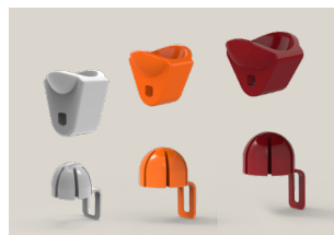
Kits de exprimido

Un sistema desarrollado por Zummo para montar y desmontar las bolas del kit en un solo movimiento.