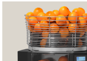
Cesta en dos tamaños

La máquina incluye de serie una cesta de 16 kg de capacidad con tapa que impide el acceso a las naranjas. En los casos en los que se necesite una autonomía menor, existe una cesta opcional que tiene una capacidad de carga de 9 kg de fruta.