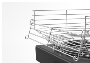
Cesta con puerta abatible

Cesta con puerta abatible que facilita la carga de frutas. Su característica doble posición permite colocar la cesta tanto en la parte frontal como en la parte trasera en función de las necesidades concretas de cada establecimiento.