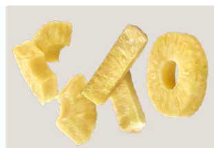
Tipos de corte

Marca la diferencia en tu negocio ofreciendo novedades al consumidor.