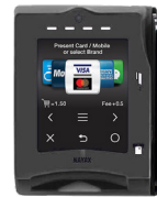
Sistema de pago

Cuenta con un sistema de pago a través del cual se activa la máquina, exprimiendo el zumo al momento. Formas de pago: Tarjetas prepago/fidelización, tarjetas de crédito/débito aplicaciones móviles/plataformas de pago.