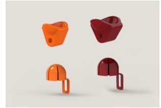
Kits de exprimido

Un sistema desarrollado por Zummo para montar y desmontar las bolas del kit en un solo movimiento.